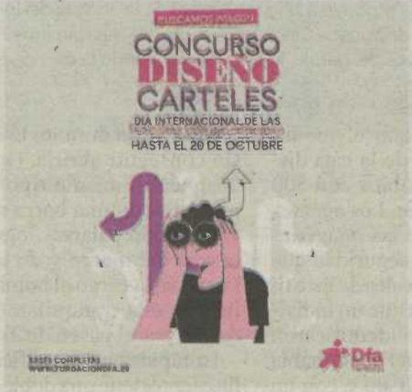
Cartel de la convocatoria.

Fundación Dfa ha convocado la XVII edición del concurso de carteles 'Buscamos Imagen'. Esta iniciativa tiene el objetivo de conseguir la plena normalización y sensibilizar a la ciudadanía sobre la discapacidad. El cartel ganador se convertirá en la imagen de la campaña del 3 de diciembre, Día Internacional de las Personas con Discapacidad.