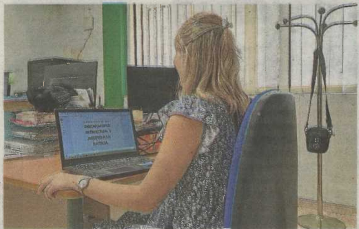
La formación se imparte 'online'.

Este curso 'online' va sobre las dificultades que tienen las personas con discapacidad intelectual