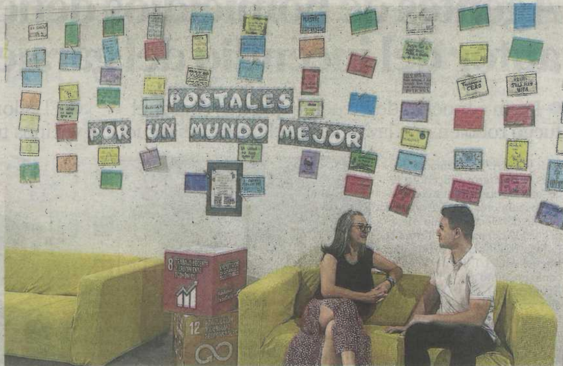
La exposición puede visitarse hasta el próximo 30 de septiembre. FUNDACIÓN IBERCAJA

La juventud es el futuro y también el presente de la sociedad, por ello es fundamental conocer sus propuestas, preocupaciones y reflexiones. Un objetivo al que