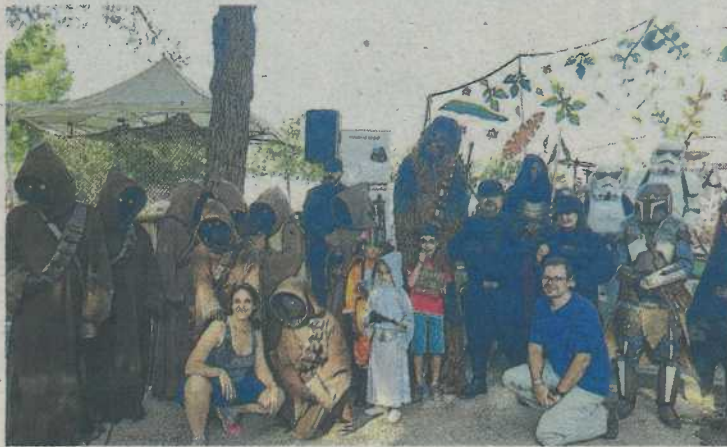
La Legión 501th en una anterior edición. F.L.A.

A lo largo de las doce anteriores ediciones, más de 3.000 personas han tenido la oportunidad de disfrutar de un encuentro muy especial, que esta edición incluirá, entre otras actividades, las actuaciones de Circo la Raspa; Cretino and The Cretiners, que se subirán al escenario para que todos